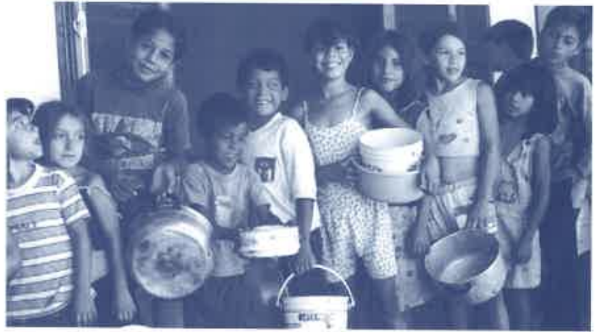
Grupo de niños que esperan llevar a su familia la comida que sirve la Cocina Solidaria, una de las obras sociales que lleva el P. Valpuesta: 40 años en el Paraguay.

En el campo de la fe sucede lo mismo. Nuestras respuestas a los cuestionamientos religiosos de hoy, no pueden ser las mismas de ayer, cuando andábamos en las aulas de la Secundaria.