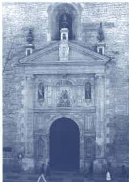
Fachada de la Iglesia de la Anunciación. Casa Profesa, Sevilla.

Ese largo período de prosperidad se interrumpirá de nuevo durante la II República. El artículo 26 de la Constitución de 1931 prescribía la disolución "de aquellas órdenes religiosas que estatutariamente impongan, además de los tres votos canónicos, otro especial de obediencia a autoridad