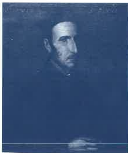
San Francisco de Borja. Residencia de Sevilla

El primer esbozo de las Constituciones de la Compañía de Jesús, de 1541, excluye la dedicación a la enseñanza, pero esta primera concepción se vio forzada a evolucionar, ya en vida del