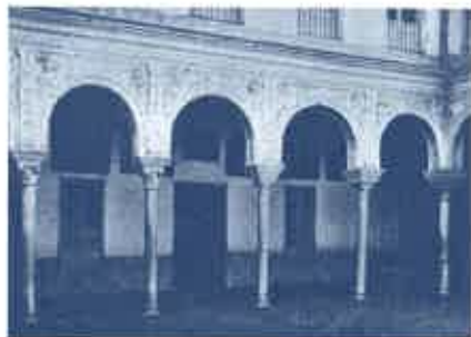
Patio del que fuera colegio de jesuitas de la calle Argote de Molina.

se realiza una actividad variada. Después de la restauración abren residencias en Trigueros (1816-1820), Utrera (hasta 1833), Cádiz (1853-1871), Sanlúcar de Barrameda (1861-1868), El Puerto Santa María (1869-1875). En Jerez también se inicia otra residencia (1876-1884) que se traslada al antiguo colegio jesuita (1884-1970) y después a la parroquia Madre de Dios (1970). En Cádiz comienza en la Santa Cueva (1905-1928), hasta que se traslada frente a la iglesia del antiguo colegio de Santiago (1928), y desde 2003 en calle Barrocal. En Córdoba se inaugura en la Real Colegiata de San Hipólito en 1878; en Granada comienza en la Iglesia del Corpus Christi (Los Hospitalicos) (1880-1898) hasta su traslado a la de la Gran Vía en 1898. En Málaga tiene varias sedes provisionales desde 1881, utilizando la iglesia de San Agustín, hasta el traslado al edificio actual de Calle Compañía en 1913. En Almería se inaugura en 1910 y se transforma en la parroquia de Piedras Redondas en 1982. En Montilla (cuya iglesia conserva los restos de san Juan de Ávila) se constituye un centro misional en 1944, gracias a la genero-