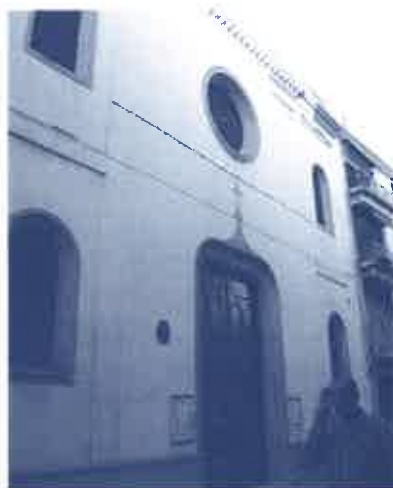
Iglesia de San Gregorio del Seminario de Ingleses. Calle Alfonso XII.

distinta de la legítima del Estado". Parece un artículo redactado pensando en la Compañía de Jesús, como lo entendió Azaña: "si la Iglesia sale de todo esto sin más pérdida que la disolución de los jesuitas, puede darse por satisfecha". Los cinco provinciales jesuitas enviaron a las Cortes un alegato en su defensa dos días antes de la votación. Protestaban por condenarlos "sin oírlos", informando también de las obras que mantenían, pero no se tuvo consideración ni con los ancianos ni con los enfermos, de manera que 3.500 españoles quedaron tirados