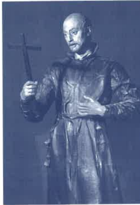
Escultura de San Ignacio de Loyola, de Martínez Montañés. Casa Profesa. Iglesia de la Anunciación.

Para aquellos entonces el Padre fundador estaba convencido de que la Compañía debía arrostrar la dedicación a la enseñanza y educación de los seglares. Aunque esta actividad quedaba excluida en el primer esbozo de las Constituciones de 1541, muy pronto Ignacio se percató de la relevancia de ofrecer los jesuitas a este ministerio, oficialmente recogido en el texto de las Constituciones aprobado por la primera Congregación General de 1558. Ya en carta a Francisco de Borja en 1548, año de la fundación del primer colegio público de la Compañía, el de Messina (Sicilia), que serviría de prototipo