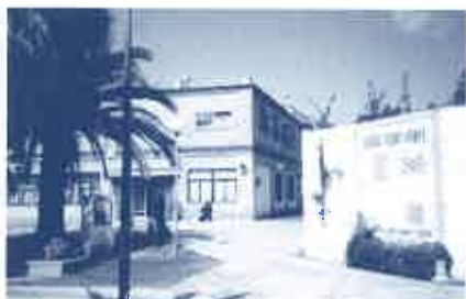
Centro Arrupe. Avda. Eduardo Dato.

se realiza una actividad variada. Después de la restauración abren residencias en Trigueros (1816-1820), Utrera (hasta 1833), Cádiz (1853-1871), Sanlúcar de Barrameda (1861-1868), El Puerto Santa María (1869-1875). En Jerez también se inicia otra residencia (1876-1884) que se traslada al antiguo colegio jesuita (1884-1970) y después a la parroquia Madre de Dios (1970). En Cádiz comienza en la Santa Cueva (1905-1928), hasta que se traslada frente a la iglesia del antiguo colegio de Santiago (1928), y desde 2003 en calle Barrocal. En Córdoba se inaugura en la Real Colegiata de San Hipólito en 1878; en Granada comienza en la Iglesia del Corpus Christi (Los Hospitalicos) (1880-1898) hasta su traslado a la de la Gran Vía en 1898. En Málaga tiene varias sedes provisionales desde 1881, utilizando la iglesia de San Agustín, hasta el traslado al edificio actual de Calle Compañía en 1913. En Almería se inaugura en 1910 y se transforma en la parroquia de Piedras Redondas en 1982. En Montilla (cuya iglesia conserva los restos de san Juan de Ávila) se constituye un centro misional en 1944, gracias a la genero-