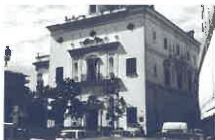
Iglesia del colegio de San Hermenegildo. Sevilla

Llegaron a abrir una casa de moriscos en el Albaicín, los acompañaron en su destierro del Reino de Granada tras el alzamiento de 1567 y, posteriormente, los atendieron en su expulsión de España de 1610. A través del Hospicio de Indias fundado en Sevilla en 1566, organismo que tramitaba todo el embarque y ayuda a las misiones, y que tuvo sedes en Sanlúcar de Barrameda, Cádiz y El Puerto de Santa María, irradiaron los jesuitas su ministerio en las Indias. También fue importante la actividad del Seminario de Ingleses, fundado en Sevilla en 1592 (uno de sus primeros profesores fue san Henry Walpole) y del Seminario de Irlandeses, fundado también en Sevilla en 1617, donde se formaban sacerdotes para volver a sus lugares de origen sabiendo que les esperaba la persecución y la muerte. El Seminario de Ingleses, estaba ubicado en la actual calle Alfonso XII, en lo que hoy es la Escuela de Estudios Hispano-Americanos, y se conserva su capilla (la iglesia de San Gregorio). El Seminario de Irlandeses estaba dentro del complejo de San Hermenegildo.