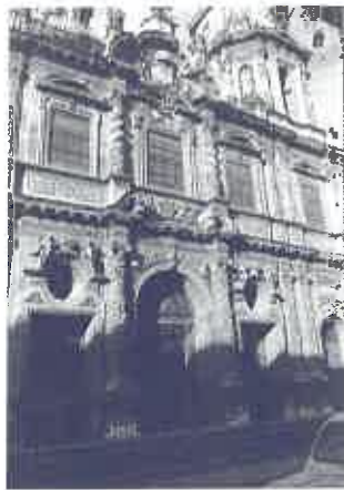
Fachada de la Iglesia de San Luis. Noviciado jesuita.

Estos colegios comenzaron siendo elitistas, pues al desaparecer el régimen financiero de la fundación, propio de la antigua Compañía, los interesados tenían que hacer frente a los gastos de la enseñanza, a falta de otros ingresos. Después de la transición política se acogieron a los conciertos educativos de la LODE de 1985, lo que permite la gratuidad al menos en los niveles de escolaridad obligatoria (Primaria y Secundaria Obligatoria). Esto facilitó lo que los mismos jesuitas pretendían, es decir, poder abrir sus