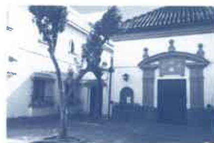
SA.FA. Sevilla. Ntra. Sra. de los Reyes. Parroquia de Ntra. Sra. de Belén.