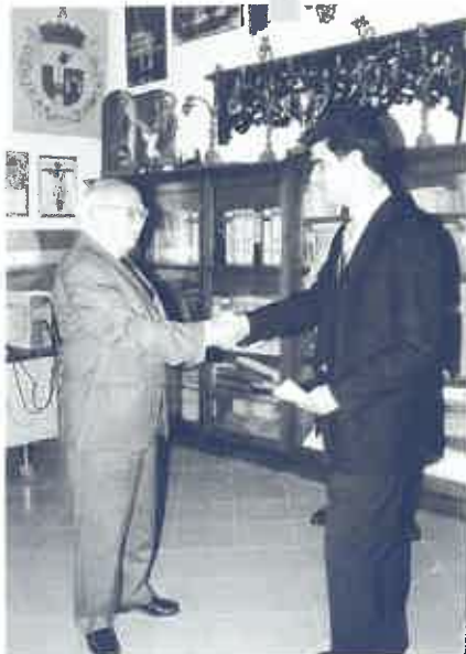
Premio mejor expediente (III edición) Curso 2003-2004

Ahora os preguntaréis qué ha sido de mí; pues bien, me matriculé en Farmacia, me van muy bien los estudios, y desde aquí quiero dar las gracias a todos los profesores por lo bien preparados que hemos llegado a la Universidad todos los alumnos de Portaceli. Pero no hay un solo día que no me acuerde de mi Colegio, allí fui muy feliz y tengo muy buenos recuerdos de mis profesores y mis compañeros. Me acuerdo de lo bien que lo pasábamos en algunas clases, cómo nos reíamos con algunos profesores, de los recreos (poder estar un rato charlando tranquilamente con tus amigos, cuando era más chico jugando al fútbol,...), del gran compañerismo que había entre los alumnos ... y de tantas otras