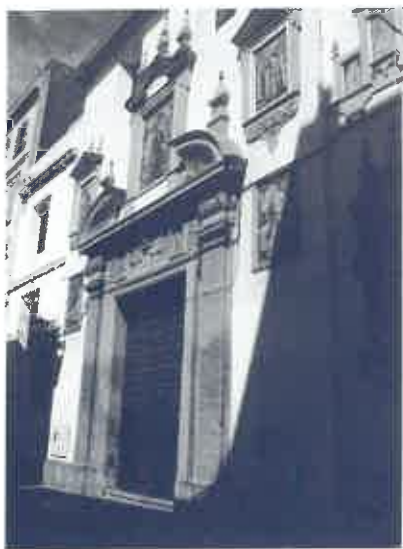
Fachada de la Iglesia del Sagrado Corazón. Residencia Jesuita. Calle Jesús del Gran Poder.

(MUIINSI), y otra muestra de la actividad científica es el Observatorio de Cartuja, inaugurado en 1902 y cedido a la Universidad de Granada en 1971, donde es de destacar la labor de Antonio Dúe.