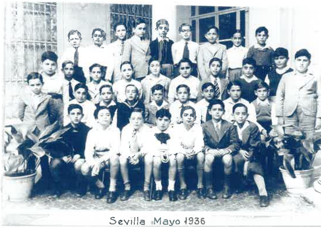
Curso escolar que efectuó el ingreso en bachillerato.