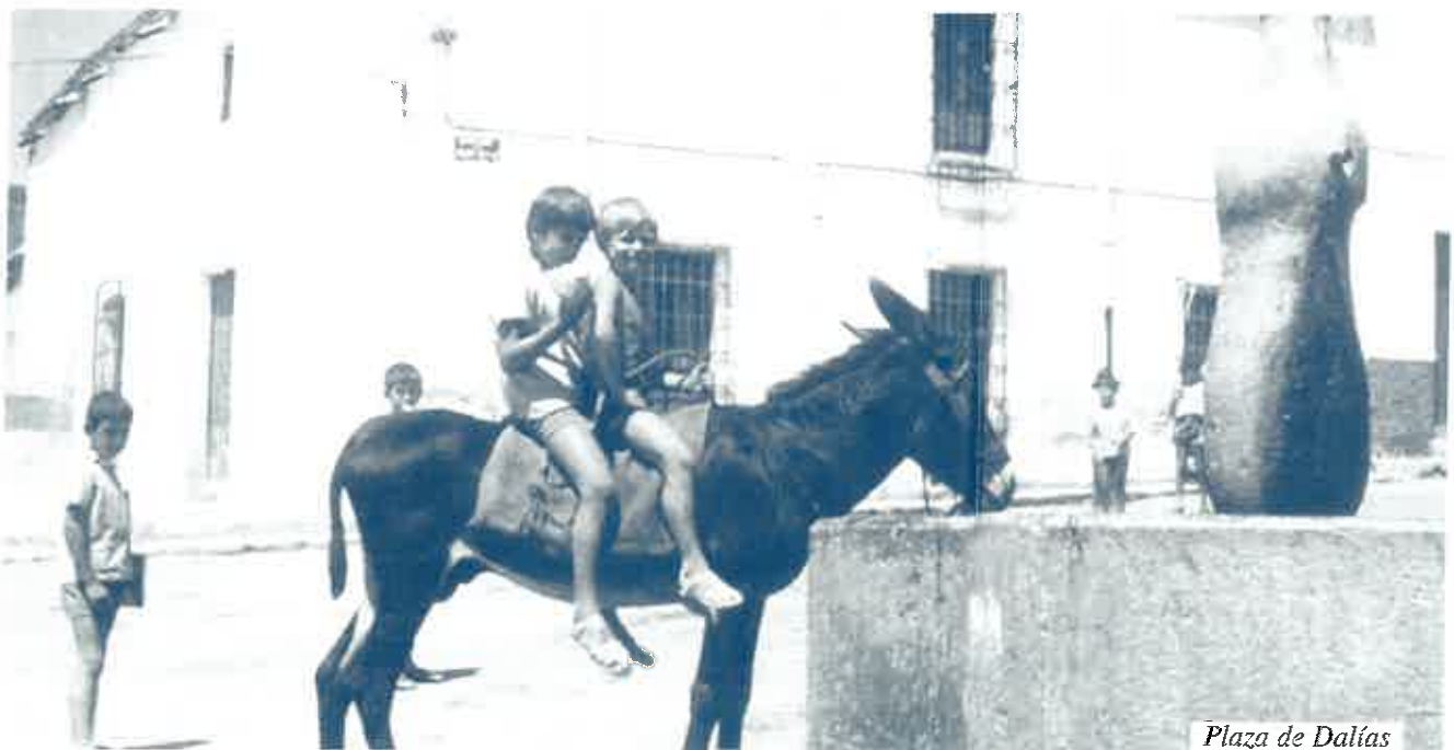
Plaza de Dalías

Quizá el pueblo cristiano en general haya entendido bien lo que significa la canonización de un cristiano, sea un cristiano del clero o religioso o simplemente seglar. En el nº 50 de la Lumen Gentium, Constitución dogmática sobre la Iglesia, el Concilio Vaticano II enseña: "Al mirar la vida de quienes siguieron fielmente a Cristo, nuevos motivos nos impulsan a buscar la Ciudad futura, y al mismo tiempo aprendemos cuál sea, entre las mundanas