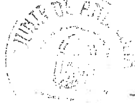
Fdo.: Cecilia Conradi Fernández